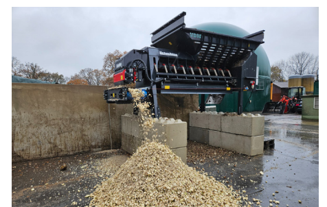
CLT mit automatischer Steinseparation