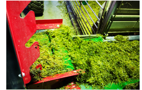
Auflösen und dosierte Ablage von Grassilage