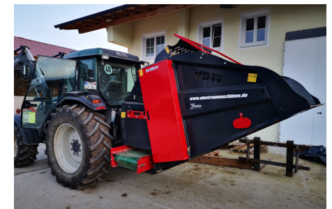
Bale Master im Dreipunkt