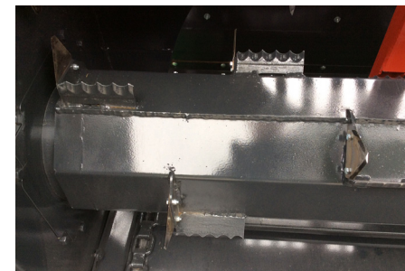
2 hydr. angetriebene Auflösewalzen