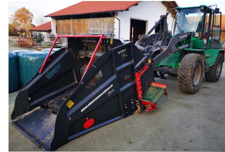
für Rund- und Quaderballen