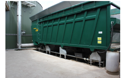
Bio Mix Combi 6000 mit Förderschnecken Typ 500