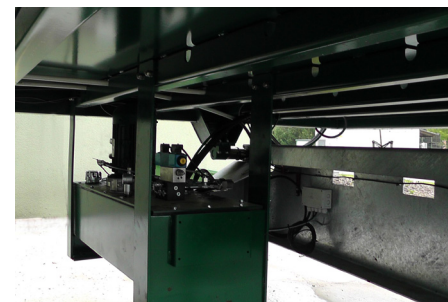
Aggregatbefestigung unter dem Container