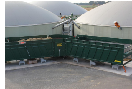
Bio Mix Combi Double 10.000