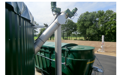
optional hydraulische Abdeckung