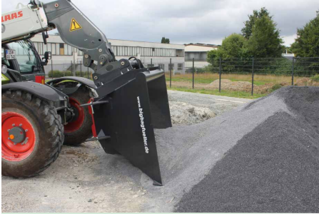
für Sand, Kies, Getreide ...