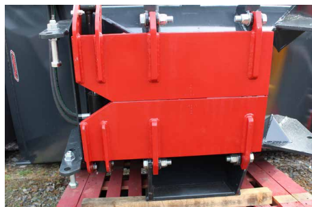
20 mm starke Entleerungskappen