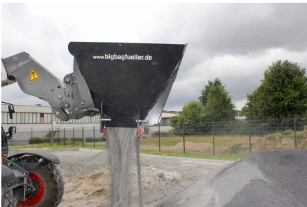
... Dünger, Pallets, etc.