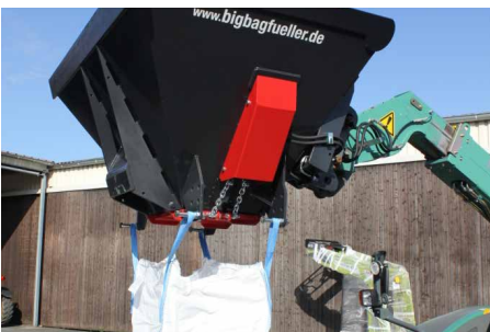
einfaches Handling und Transportieren