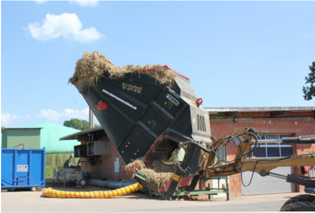
für Rund- und Quaderballen