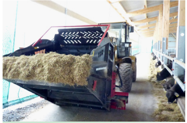
Einstreuen von Stroh