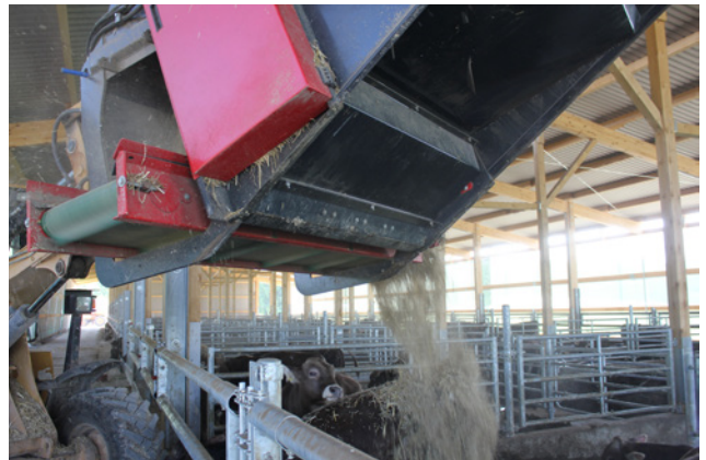
Füttern und Einstreuen mit einer Maschine