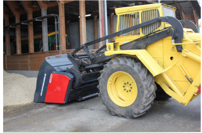
für unterschiedliche Rad- und Hoflader