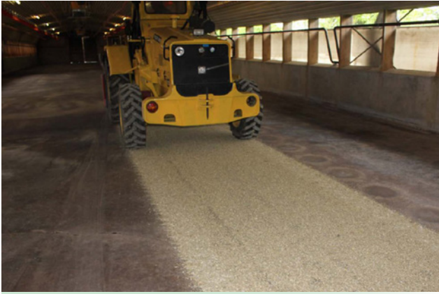
exakte gleichmäßige Verteilung durch Bodenantrieb