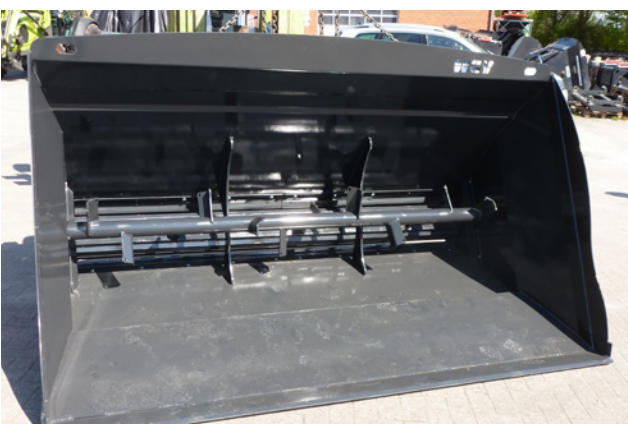
Dosier- und Auflösewalze