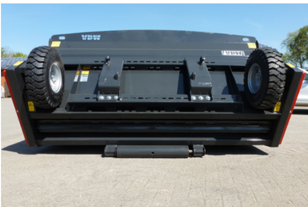
schonendes Beladen über Bodenrolle, exaktes Dosieren über Tasträder