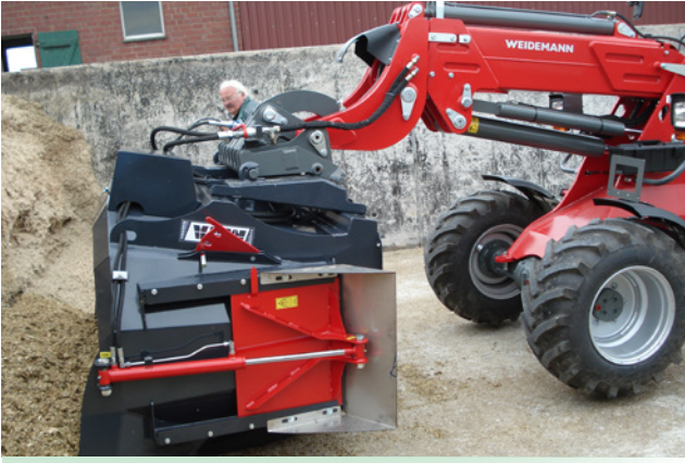
1 DW-Steuergeräte u. 1 druckloser Rücklauf