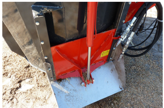
Austrag über hydraulisch betätigte Türen