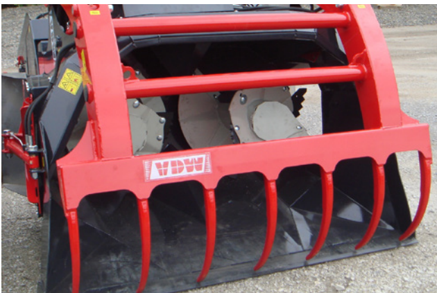
verschiedene Entnahmewerkzeuge (siehe Seite 84/85)