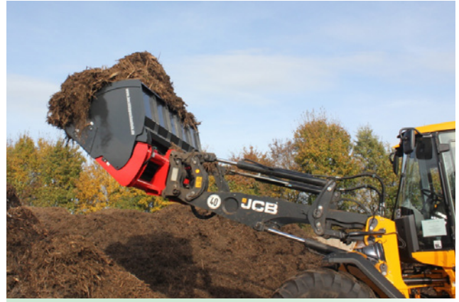
hoher Füllungsgrad durch seitl. Schaufelerhöhung