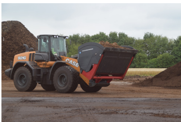
6 m 3 Schaufel