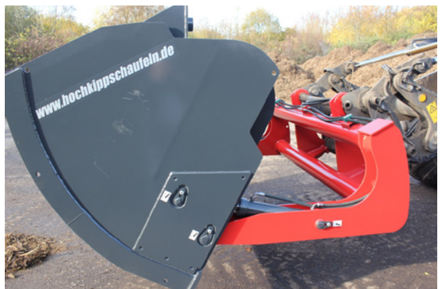
Zylinder geschützt in Seitenwange