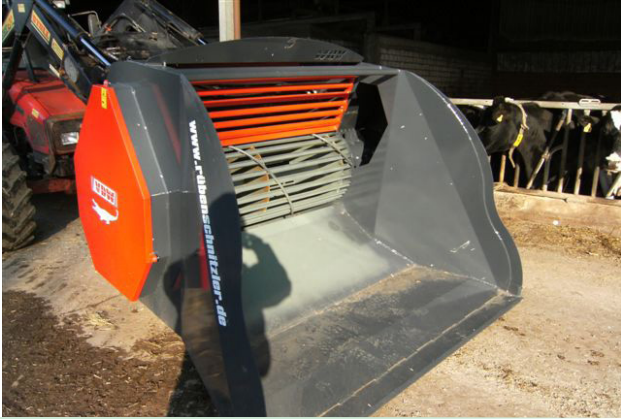
600 kg Ladevolumen