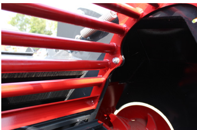
Reinigungsgitter mit Fremdkörperschutz