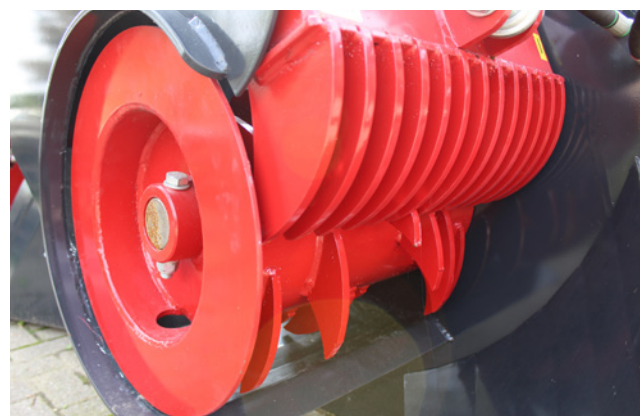
Bröckelwalze mit Gegenschneide