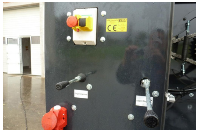
Bedienung / Anschluss