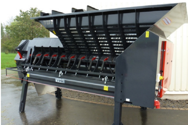
4 Stützfüße - höhenverstellbar max. 1.5 m unter Walze