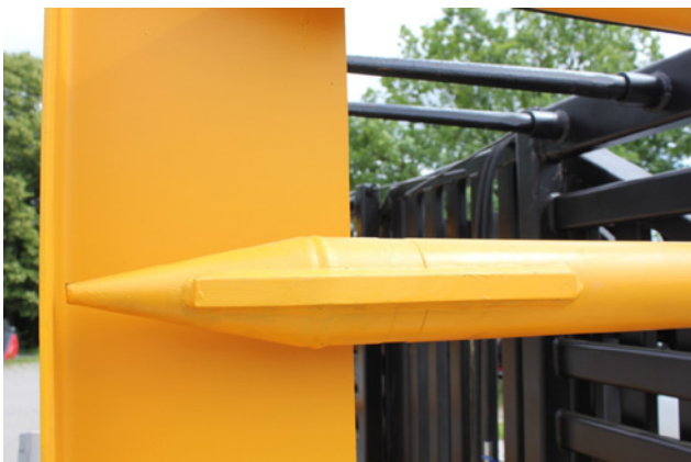
12 mm Hardox Verschleißschutz