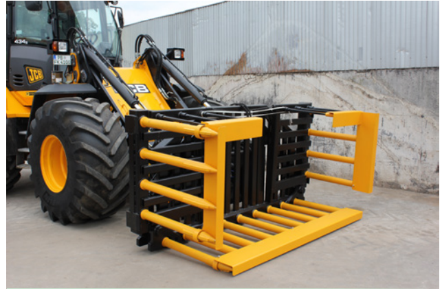
Transportbreite 2370 mm 3-teiliger Zinkenschutz für Straßenfahrt