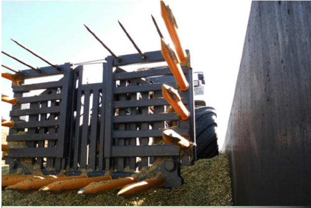
schmalste Maschine am Markt