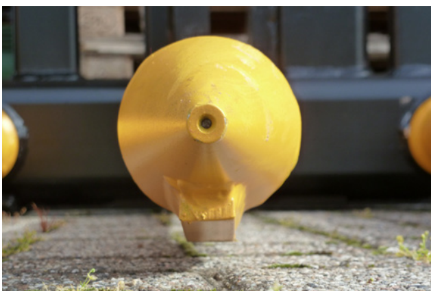
86 mm Ø 50 mm über dem Boden austauschbare Schwerlastzinken