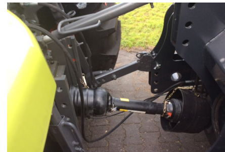
Antrieb mit Gelenkwelle