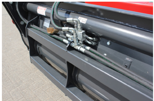
Hydr. Folgeschaltung, nur 1 DW erforderlich