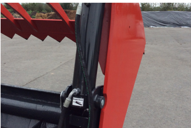
Schutz vor Zylinderbeschädigung