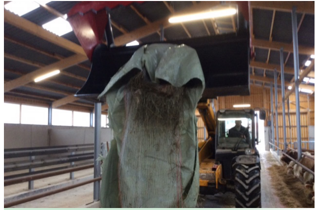
verzinkte Greifzähne für zuverlässigen festen Folienhalt