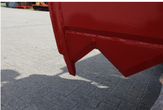
Eckzähne verhindern Beschädigung der Messer