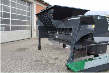
Zuladung ca. 2200 kg