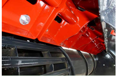
Reinigungswalze mit Federklappen