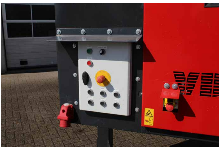
Bedienung / Steuerung