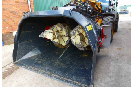
Mini Mix Mega 2600