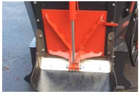
Austrag über hydraulisch betätigte Türen mit flexibler Austragsrutsche