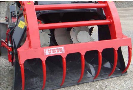
verschiedene Entnahmewerkzeuge (siehe Seite 80)